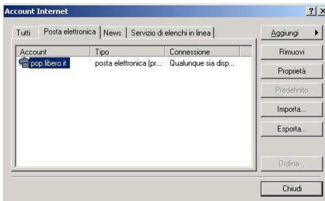
Figura 2: settings