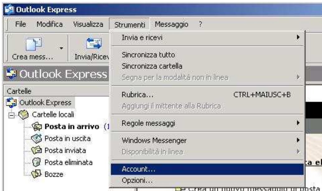
Figura 1: main