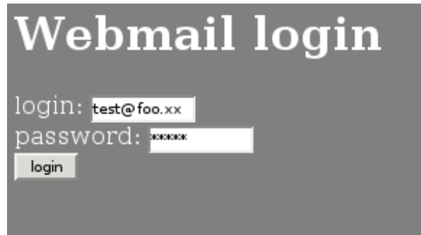
Figura 5: login

pagina di login della webmail vista con Mozilla e il codice sorgente della stessa pagina (con Mozilla lo si vede con Ctrl-U, figura 5).