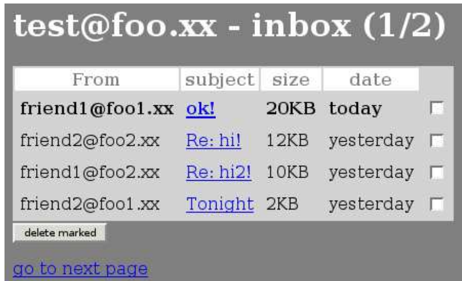
Figura 7: inbox

<input type="hidden" name="session_id" value="ABCD1234"> <table> <tr><th>From</th><th>subject</th><th>size</th><th>date</th></tr> <tr> <td><b>friend1@foo1.xx</b></td> <td><b><a href="/read.php?session_id=ABCD1234&uidl=123">ok!</a></b></td> <td><b>20KB</b></td> <td><b>today</b></td> <td><input type="checkbox" name="check_123"></td> </tr> <tr> <td>friend2@foo2.xx</td> <td><a href="/read.php?session_id=ABCD1234&uidl=124">Re: hi!</a></td> <td>12KB</td> <td>yesterday</td> <td><input type="checkbox" name="check_124"></td> </tr> </table> <input type="submit" value="delete marked"> </form> <a href="/inbox.php?session_id=ABCD1234&page=2">go to next page</a> </body>